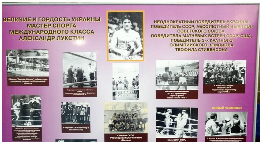
На фотографии фото-стенд, посвящённый А. Лукутину.

Теофило Стивенсон, конечно, прекрасный боксёр, но Александр Лукутин его победил.