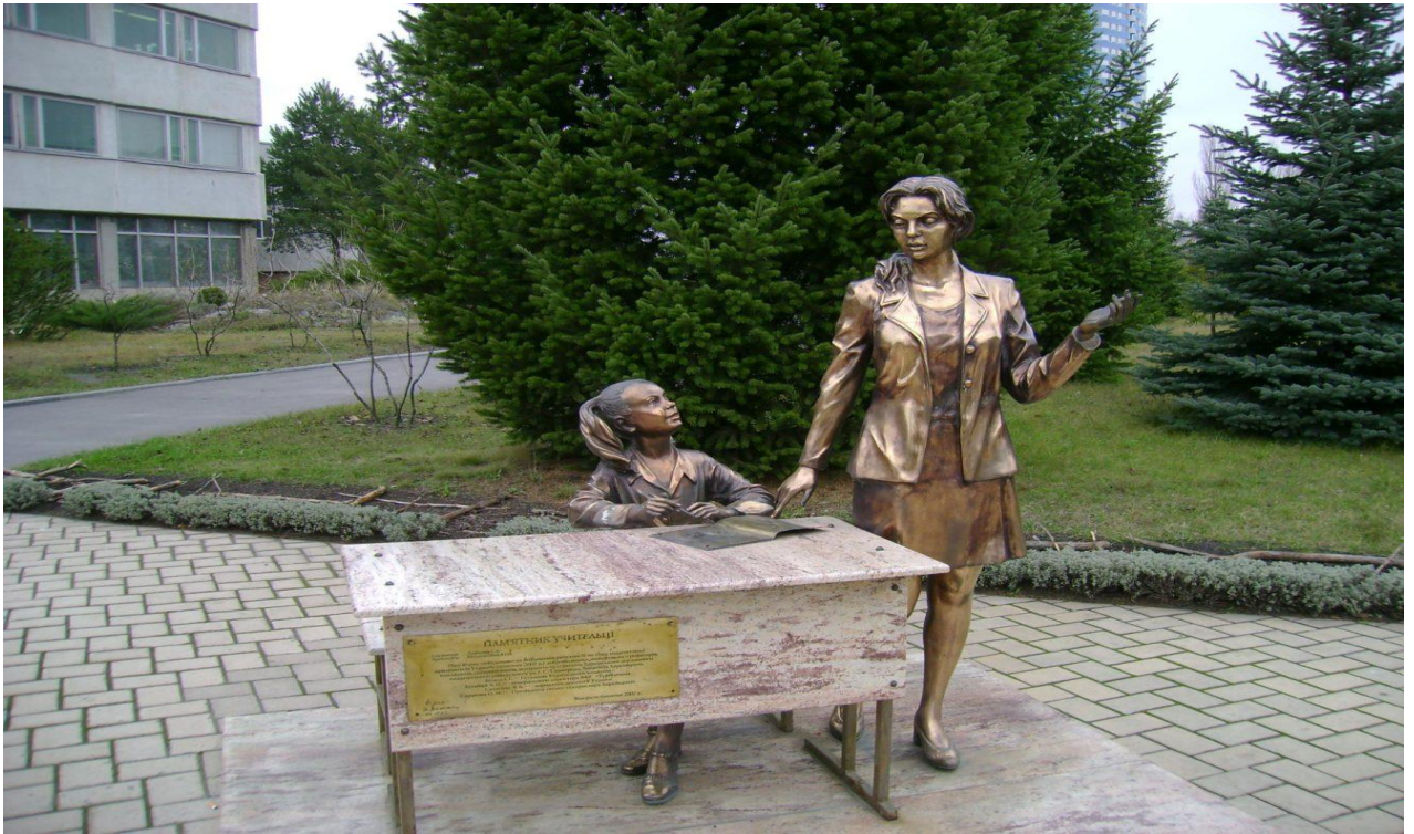
Пам'ятник першій вчительці біля навчального корпусу ХНПУ імені Г. С. Сковороди (вул. Валентинівська, 2)