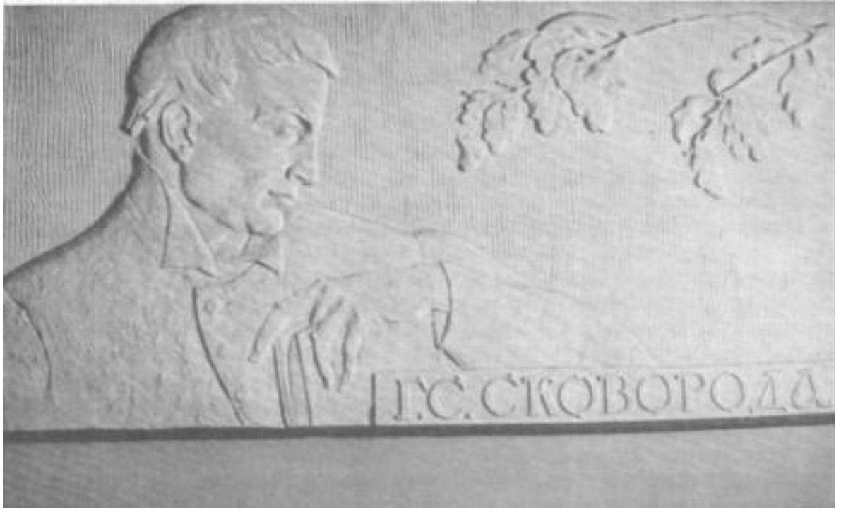
Стела Г. С. Сковороді у Харківському національному педагогічному університеті. Скульптор Д. Г. Сова.