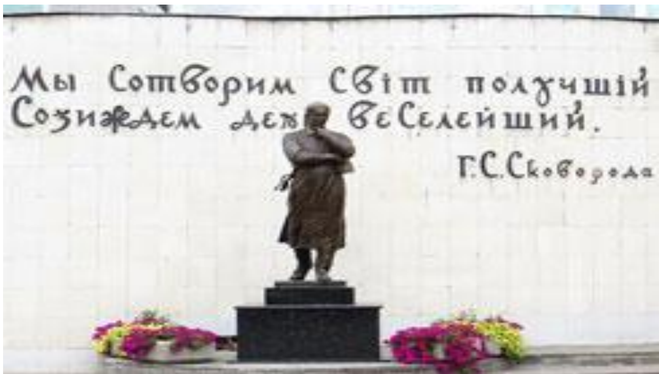
Пам'ятник Г. С. Сковороди біля стін Харківського національного педагогічного університету імені Г. С. Сковороди