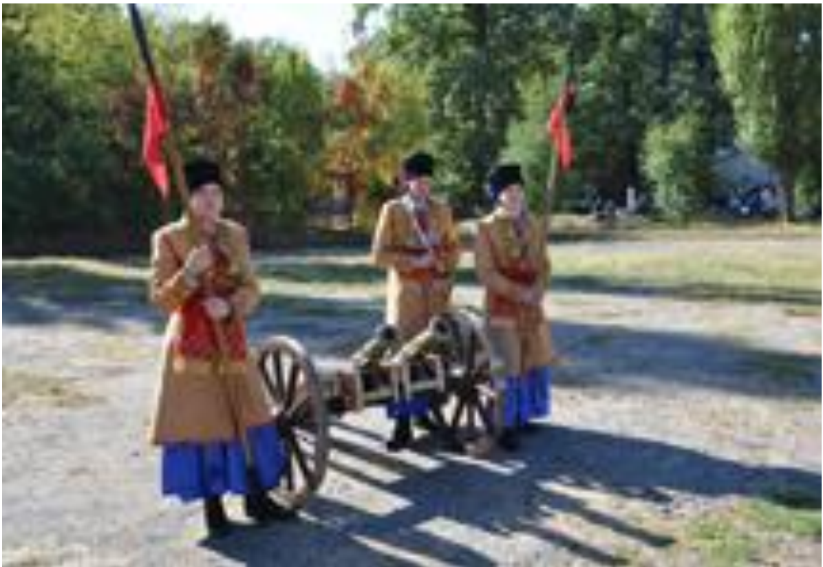
Лицарські традиції університету