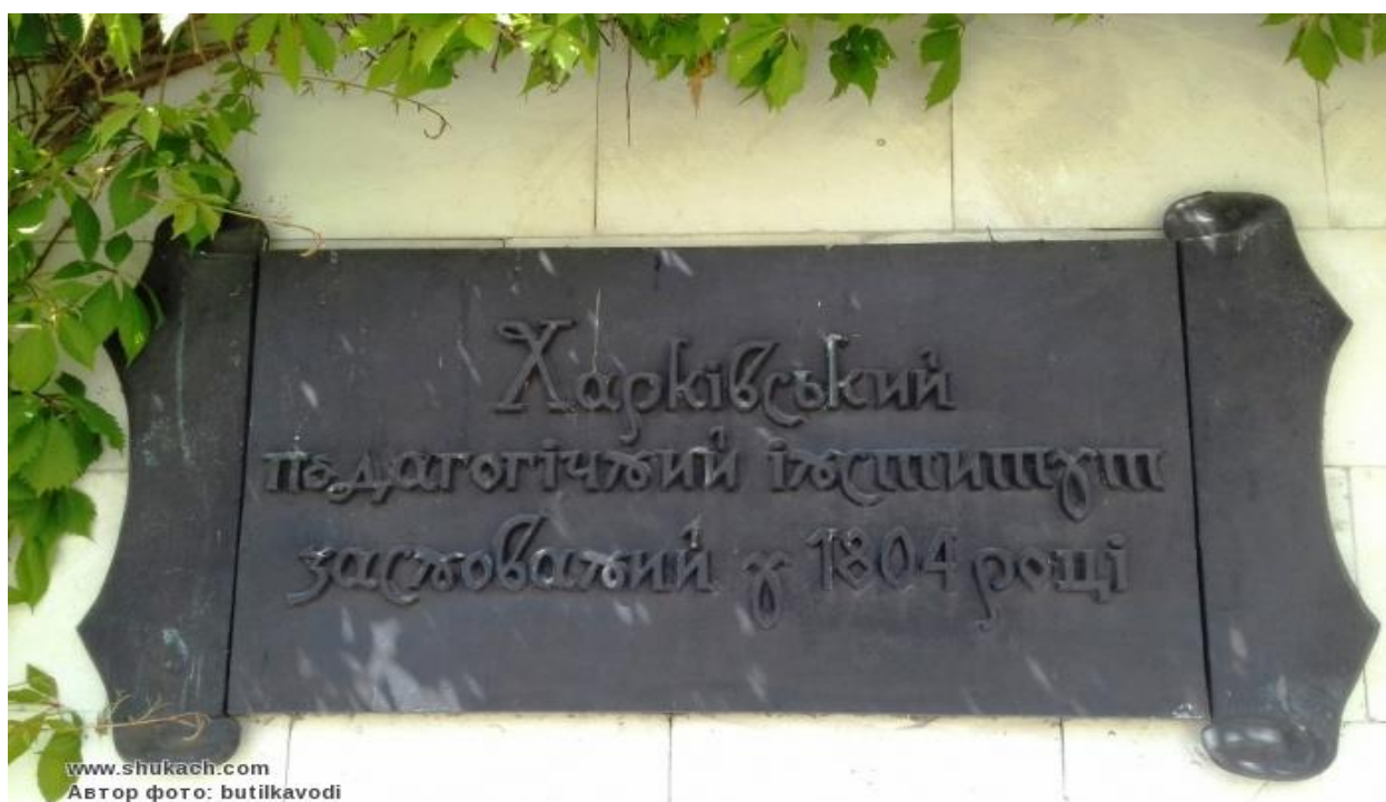
Пам'ятна дошка про заснування ХНПУ імені Г. С. Сковороди, м. Харків