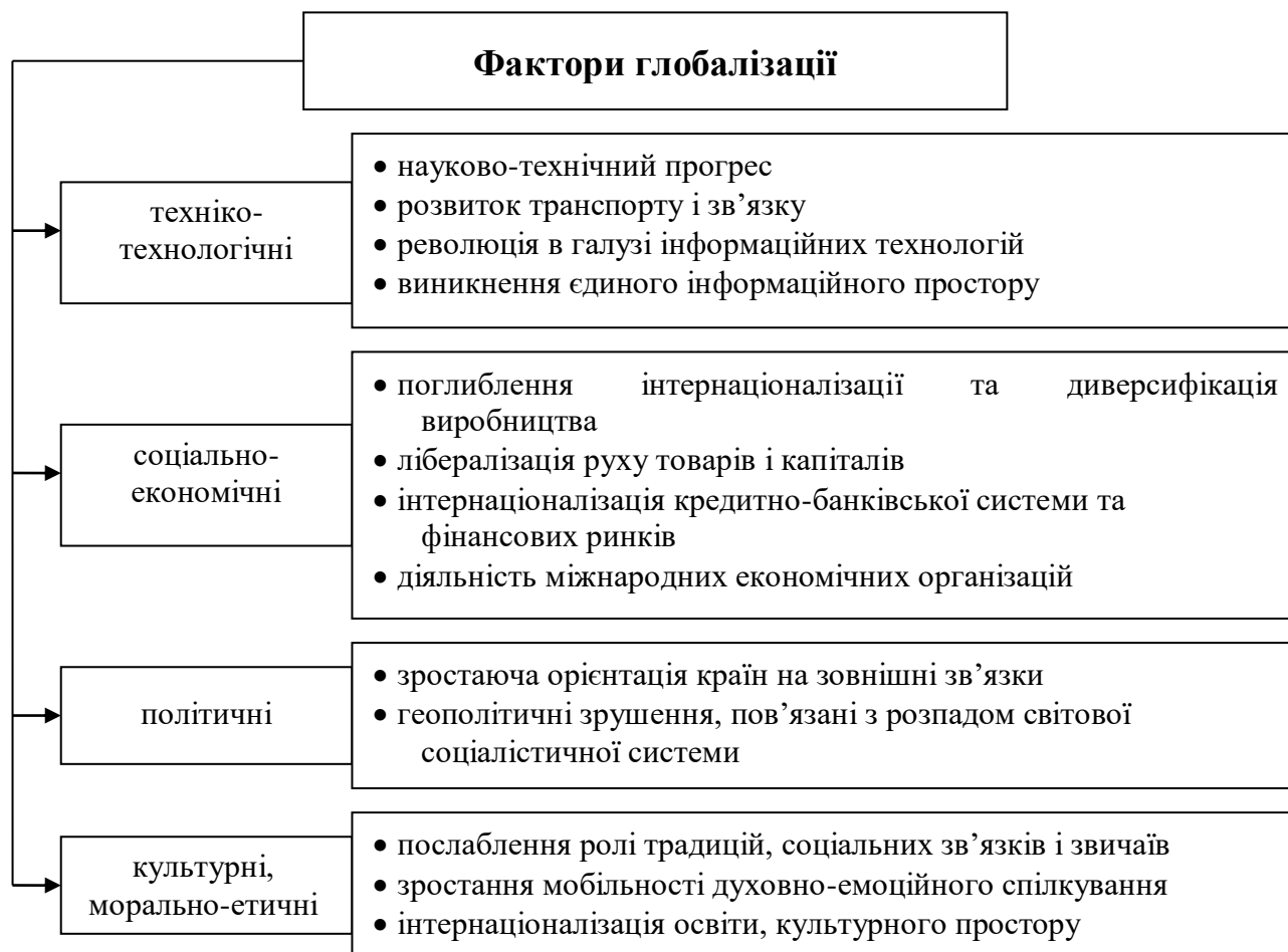
Рис. 19-1. Фактори глобалізації.

Вітчизняні компанії також орієнтуються у своїй діяльності на світовий ринок. Завдяки міжнародній торгівлі, світові ціни та техніко-економічні показники, стають критеріями ефективності окремого підприємства, галузі, національного господарства.