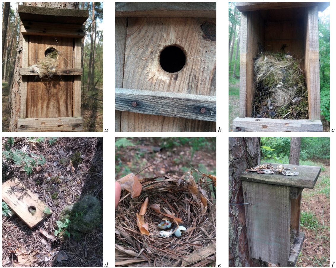
Рис. 1. Наслідки хижацтва Martes martes : a — загальний вигляд ШГ, у якій зруйноване гніздо Parus major , b — сліди кігтів на передній стінці ШГ, c — розірвані частини гнізда у ШГ, d — зруйноване гніздо з виломаною передньою стінкою ШГ, e — розбиті яйця птахів, f — фрагменти пір'я та кістки птаха.