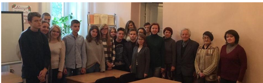
4 жовтня 2018 року у читальному залі № 1 зі студентами 1 курсу історичного факультету була проведена тематична зустріч, присвячена Всеукраїнському дню бібліотек