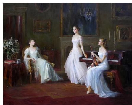
“Тургенівська дівчина”. Худ. Келвін Лей

До наших днів зберігся вислів «Тургенівська бариня». Сам Тургенєв сприймає своє життя, як особисту драму: “Осуджений я на циганське життя і не звити мені, видно, гнізда ніде і ніколи”.