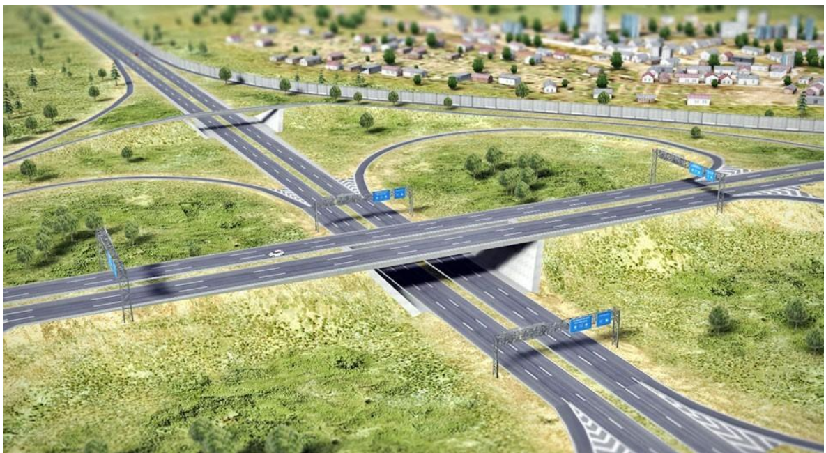
Рис. 2. Дорожній ландшафт.

Отже, на сьогодні різноманітність антропогенних ландшафтів досить велика і потребує набагато більшої уваги в шкільній програмі з географії, тому потрібно запровадити на регіональному рівні вивчення ландшафтів своєї місцевості і їх різноманіття. Було б доцільно включити й виокремити тему в календарно-тематичному плануванні як «Ландшафтне різноманіття своєї