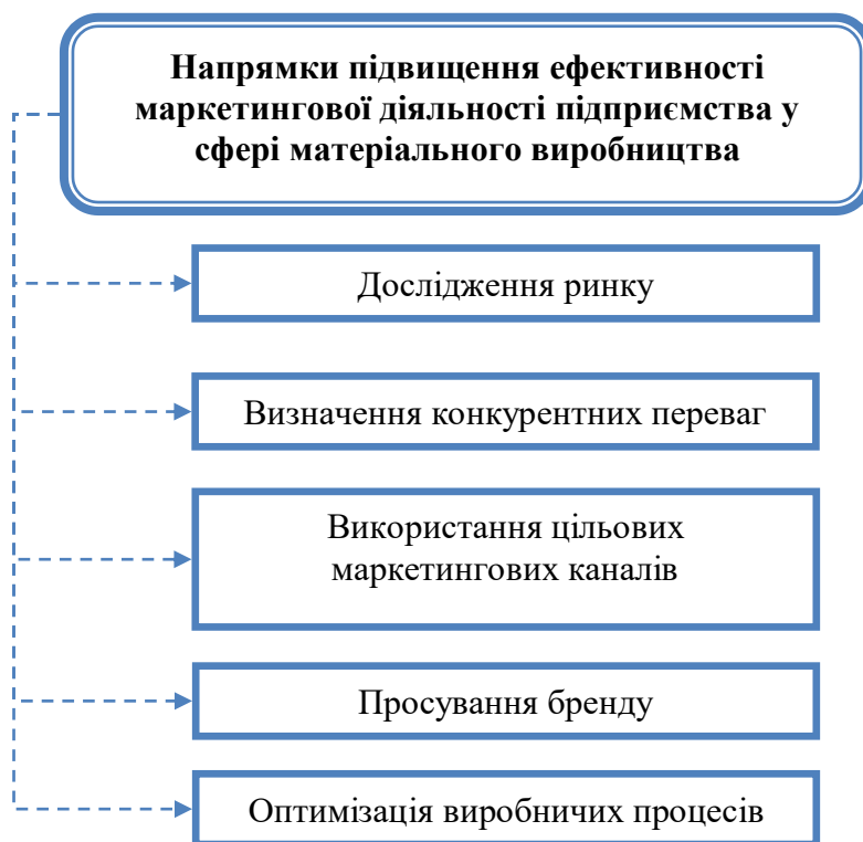
Рис. 2. Напрямки підвищення ефективності маркетингової діяльності підприємства у сфері матеріального виробництва

Розглянемо означену проблему в умовах підприємства матеріальної сфери виробництва [9-11]. Перелік напрямків, які можуть допомогти підвищити ефективність маркетингової діяльності підприємства у сфері матеріального виробництва, зазначений на рис. 2.