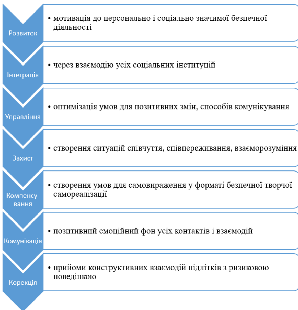
Рис. 2. Супровід підлітків зі схильністю до ризикової поведінки

Ми переконані в тому, що успішне формування життєвих ціннісних орієнтацій у підлітків, схильних до ризикової поведінки, полягає в якості комунікації. Для цього підліткам важливо усвідомити такі посили: «Будьте зрозумілими й послідовними у своїй комунікації. Чітко визнавайте, що Вам відомо, а що – ні. Будьте доступними для запитань і зворотного зв'язку навіть у період «тиші». Не применшуйте ситуацію ризику».