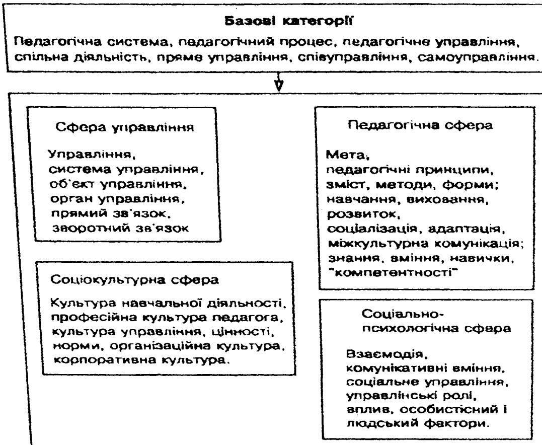
Рис. 1. Основні категорії наукового напрямку управління в педагогічній науці

з точки зору соціології — соціальну інституцію (навчальний заклад, підприємство тощо) — об'єднання людей, в межах якого може бути досягнена спільна для всіх мета; вид діяльності; ступінь внутрішньої впорядкованості [4, с. 218–219];