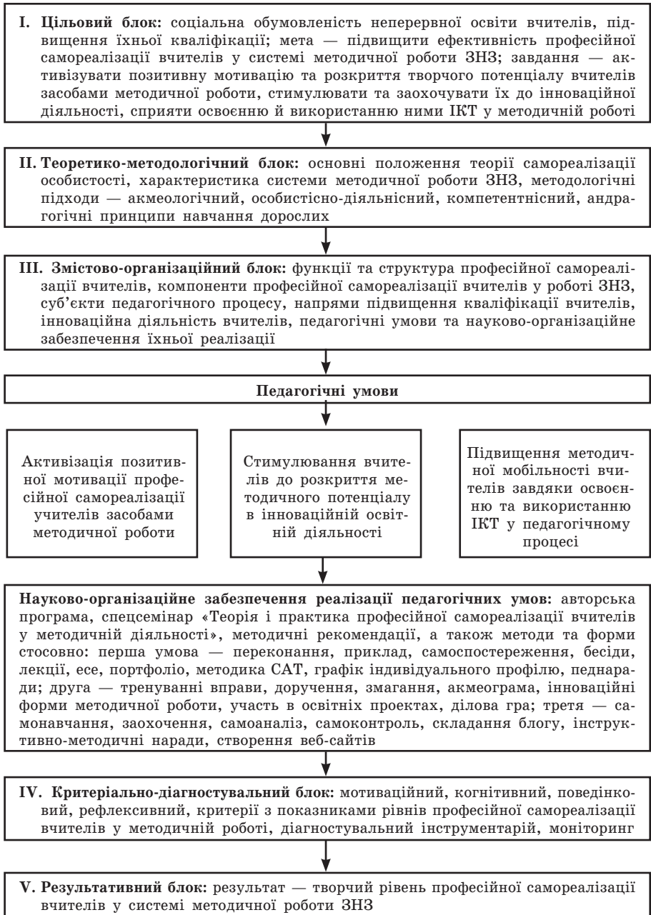
Рис. 2. Модель науково-організаційного забезпечення реалізації педагогічних умов професійної самореалізації вчителів у системі методичної роботи загальноосвітніх навчальних закладів