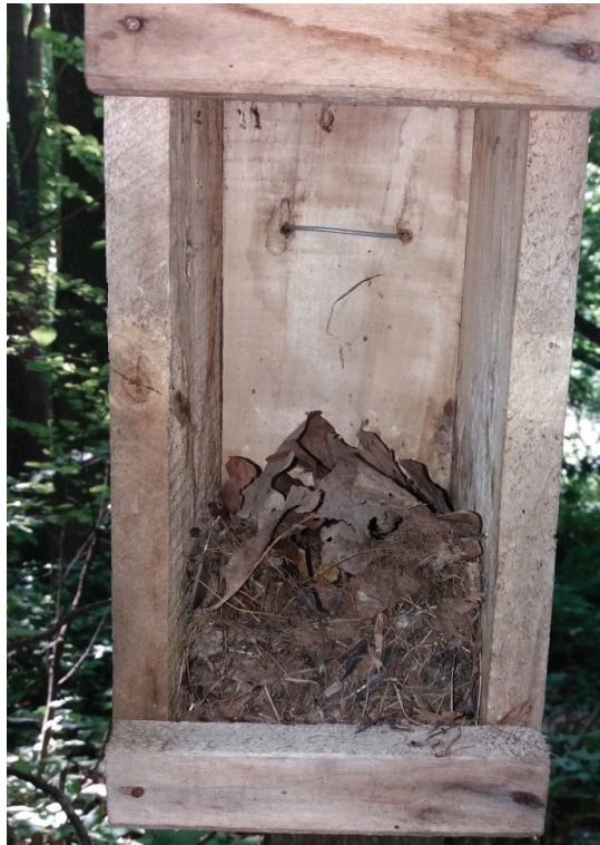
Рис. 6. Штучна гніздівля з гніздом Sylvaemus tauricus.

Мишак жовтогрудий, або жовтогорла “миша” ( Sylvaemus tauricus ) розповсюджений по всій Європі, переважно заселяє широколистяні ліси (Башта, Потіш, 2017). Переважає у дібровах з ліщиновим підліском. У ШГ після їх перебування у несприятливий період, залишається шкаралупи жолудів та лісових горіхів, листя. Приступає до розмноження з III декади березня (27.03.2012; 4.04.2013; 30.03.2016). Під час перевірки ШГ 18.05.2019 виявлений виводок Sylvaemus tauricus можна вважати другою генерацією. Цей вид має до 5 циклів на рік, вагітність триває 20-25 днів, зазвичай кожна самка приносить 5-6 малят (рис. 6-7.). Наприкінці літа до розмноження приступають цьогорічні самки. Під час досліджень, Sylvaemus tauricus показав толерантне відношення до втручання людей у штучну гніздівлю. У випадку небезпеки, дорослі особини залишали останню: вистрибували або швидко переміщувалися по стовбуру дерев чи гіллям чагарників. Зазвичай, миші активні вночі, що підтверджує їх шурхотіння поміж листями. Звичайно Sylvaemus tauricus риє прості нори під колодами, серед коріння дерев або під купами хмизу.