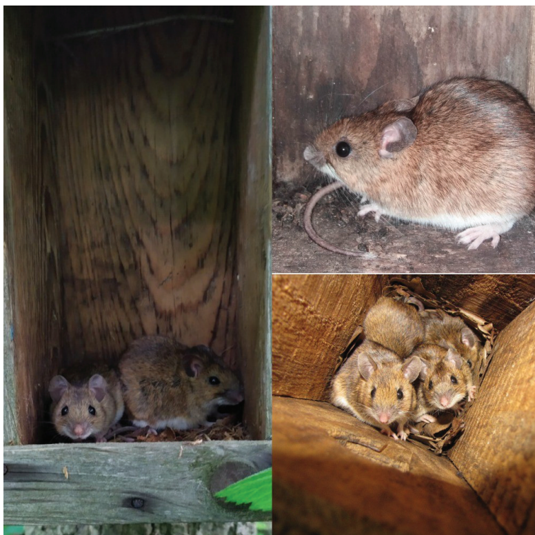
Рис. 4. Sylvaemus tauricus у штучній гніздівлі.