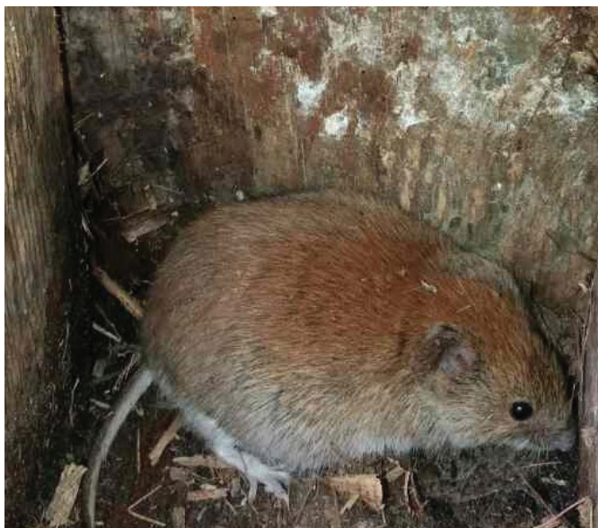
Рис. 5. Microtus arvalis у штучній гніздівлі.