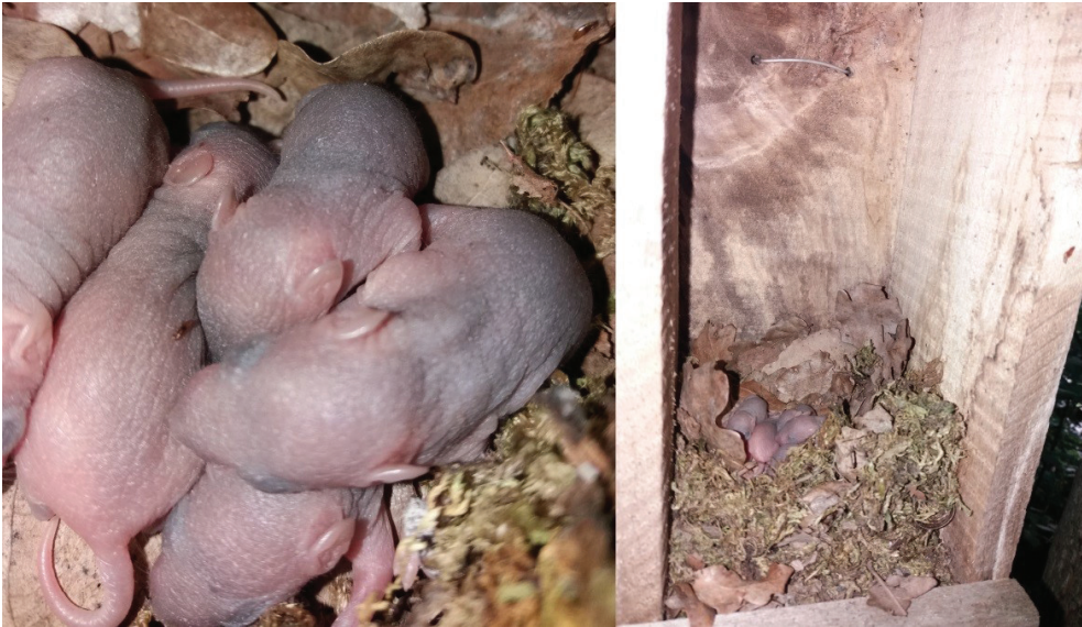
Рис. 7. Малята Sylvaemus tauricus у штучній гніздівлі.

Полівка руда (лісова), або полівка європейська руда (лісова) Microtus arvalis – вид гризунів роду лісових полівок Myodes або Clethrionomys . Ареал охоплює лісову зону Палеарктики від Європи до Байкалу. Трапляється по всій території України. Переважно селиться в широколистяних лісостанах, чагарниках, на берегах водойм з багатим рослинним покривом (Башта, Потіш, 2017).