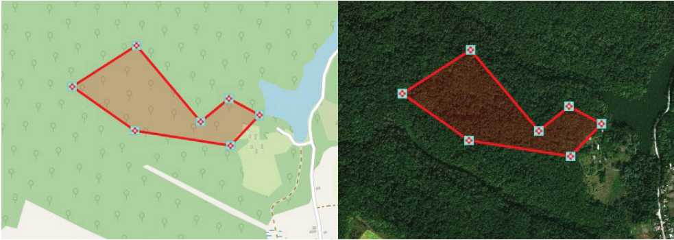
Рис. 1. Схема розташування модельної трансекти I – “Експерсійні стежки біостаніонару”.

вали у середньому через кожні 7 метрів. Для розрахунку та опису досліджуваних трансект, використовували загальнодоступну карту 3rplaneta.com та сервіси googlemaps.