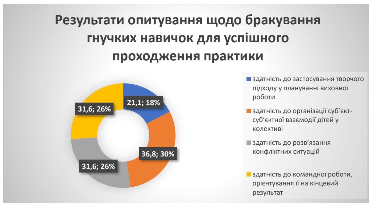
Рис.3 Результати опитування щодо бракування гнучких навичок для успішного проходження практики

На основі аналізу результатів проведеного анкетування також встановлено, що практикантам для успішного проходження літньої педагогічної практики в дистанційному форматі, а саме – для виконання програми практики та звітування, бракувало певних гнучких навичок, як-от: здатності до застосування творчого підходу у плануванні виховної роботи – 21,1%, спроможності до організації суб'єкт-суб'єктної взаємодії дітей у колективі – 36,8 %, здатності до розв'язання конфліктних ситуацій – 31,6 %, умінь командної роботи, орієнтування її на кінцевий результат – 31,6 %. На рис.3 отримані результати представлено у вигляді діаграми.