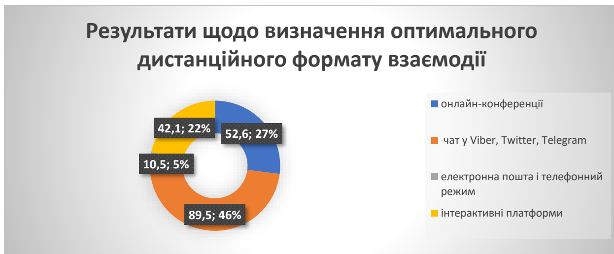
Рис. 1 Результати щодо визначення практикантами оптимального для них дистанційного формату взаємодії

проведення онлайн-конференцій – 52,6 %, спілкування з методистами й одногрупниками за допомогою використання електронної пошти і телефону – 10,5%; комунікація на інтерактивних платформах – 42,1%.