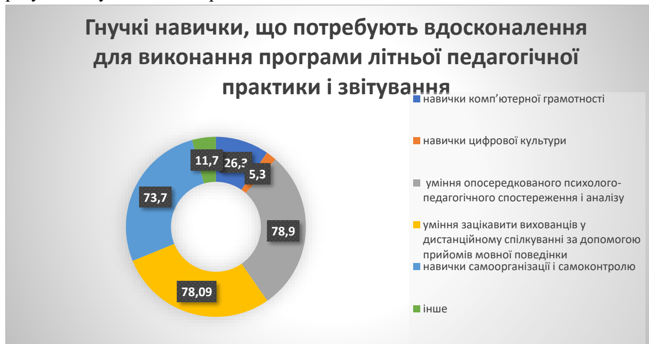
Рис. 4 Гнучкі навички, що потребують вдосконалення для виконання програми літньої практики і звітування

За даними анкетування щодо виявлення гнучких навичок, які потребують удосконалення для виконання програми літньої педагогічної практики і звітування, практиканти відзначили такі: навички комп'ютерної грамотності, які дозволяють використовувати більш широкий перелік програм для оформлення документів і виконання творчих завдань – 26,3 %, навички цифрової культури (правила використання з навчальною метою листування, чатів, використання Google-диску, Google-форми, психолого-педагогічний аналіз сторінок у соцмережах) – 5,3 %, уміння опосередкованого психолого-педагогічного спостереження й аналізу – 78,9 %, уміння зацікавити вихованців у дистанційному спілкуванні за допомогою прийомів мовної поведінки – 78,9 %, навички самоорганізації й самоконтролю – 73,7 %, інше – 11,7 %. Під рубрикою «інше» студенти вказали, що не виявили в себе таких гнучких навичок, які потребують вдосконалення, оскільки вважають, що мають достатньо розвинуті всі зазначені гнучкі навички. На рис. 4 представлено ці результати у вигляді діаграми.