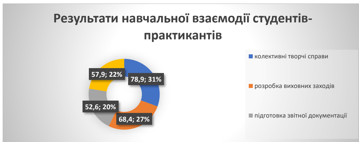
Рис.2 Результати навчальної взаємодії студентів-практикантів

Аналіз результатів анкетування засвідчує, що активність практикантів під час проходження літньої педагогічної практики в середовищі однокласників через участь у різноманітних формах навчальної взаємодії розподілилася таким чином: організація та проведення колективних творчих справ – 78,9 %; розробка планів виховних заходів – 68,4 %; підготовка звітної документації – 52,6 %; створення й розміщення презентацій, відеоматеріалів на інтерактивній дошці – 57,9 %.