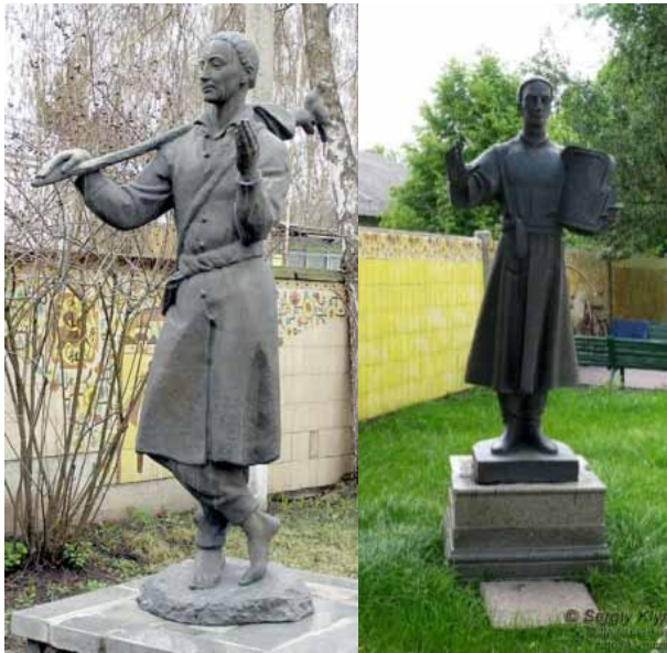
Пам'ятники Г. Сковороди в місті Перяслав-Хмельницький.