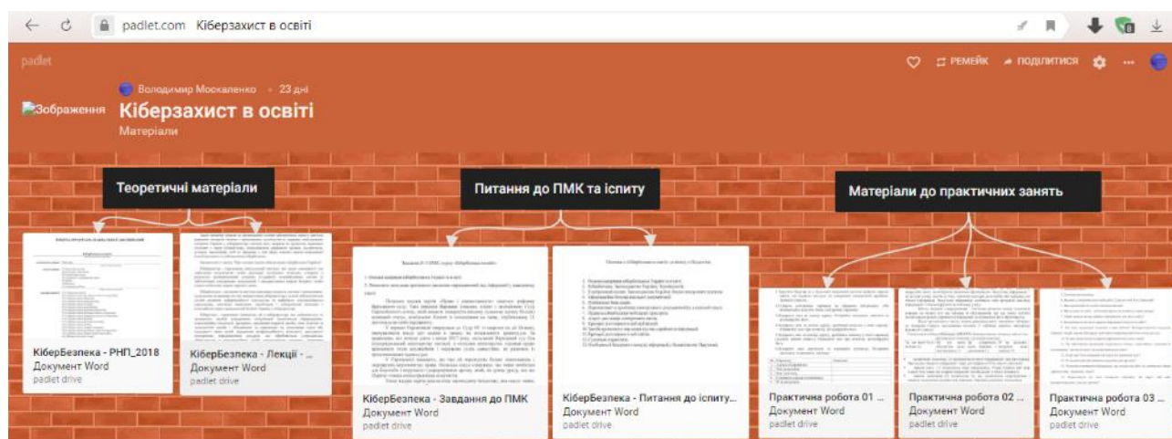
Рисунок 2. Дошка об'яви (padlet). Видно викладені методичні матеріали (файли у форматі «Документ Word») щодо теоретичного, практичного та підсумкового наповнення курсу.

У пункті «Поділитися» є можливість створити посилання на матеріал як у вигляді текстової строки так і у вигляді QR-коду. Посилання у вигляді тексту може бути розповсюджене за допомогою соціальних мереж або мобільних груп у комунікаторах на кшталт Viber'у. Посилання у вигляді QR-коду може бути роздруковане або додане до презентації і за допомогою мобільних пристроїв швидко зчитане студентською спільнотою.