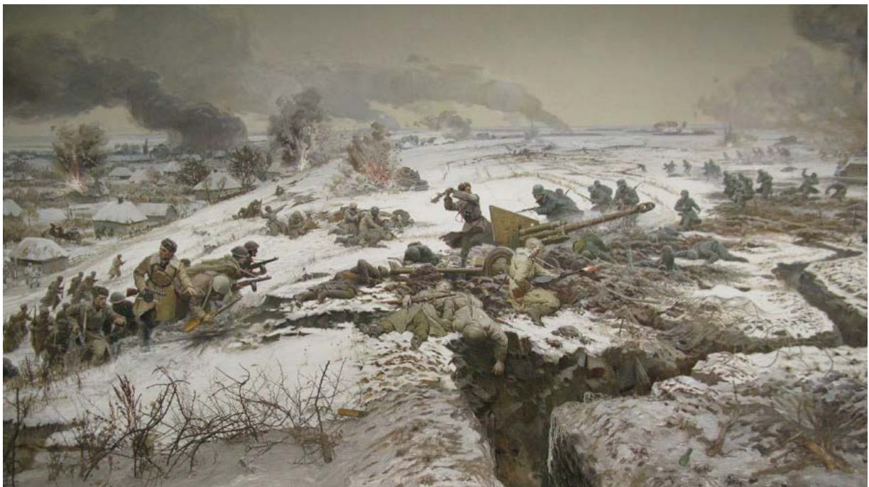
Діорама «Бій біля с. Соколове 8 березня 1943 року»: О. Ярош веде 1-шу роту 1-го ОЧПБ в атаку (з експозиції Зміївського краєзнавчого музею)