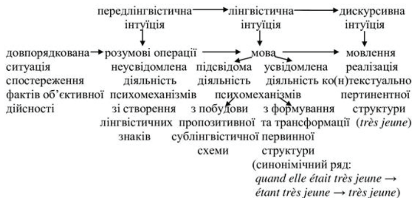
Рис. 4. Прямий напрям процесу формування та реалізації синонімічної конструкції

Представимо схематично прямий та зворотний напрями процесу формування та реалізації аналізованої синонімічної конструкції (рис. 4 та 5):