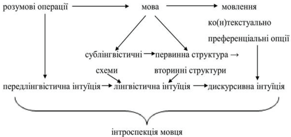
Рис. 2. Взаємозв'язки інтуїції й інтроспекції при формуванні та реалізації синонімічних конструкцій

Отже, інтроспекція мовця покриває інтуїтивні операції формування та реалізації синонімічних конструкцій, оскільки суб'єкт мовлення виступає «автооцінювачем» [Obreja, 2012, с. 151] (оцінювачем результату взаємовідношень лінгвістичної і дискурсивної інтуїції) завдяки інтроспективному аналізу, що передбачає вибір тієї чи іншої структури із низки віртуальних трансформів-синонімічних мікрополів функціонально-семантичного макрополя синтаксичної синонімії з метою її актуалізації у вигляді мовленнєвої інновації-ко(н)текстуально преференціальної опції згідно з певною комунікативною інтенцією та прагматичним плануванням розповіді.