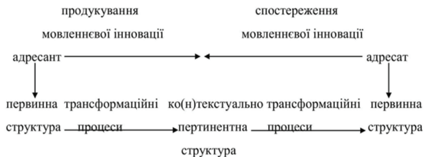
Рис. 3. Двоспрямована трансформація синонімічних структур

Продемонструємо шляхом залучення стратегій «альтернативного» лінгвістичного експерименту, результат якого залежить від ступеня здійснення подвійної рефлексії, тобто самоідентифікації реципієнта з адресантом та навпаки як «актантів літературного поля» [Кропивко, 2022, с. 24], яким чином у процесі зворотної реконструкції відтворюються мікрополя компонентів функціонально-семантичного макрополя синтаксичної синонімії, розпізнається комунікативна інтенція адресанта полегшити або ускладнити адресату інтерпретацію повідомлення і визначається ступінь ко(н)текстуальної пертинентності актуалізованої конструкції та всіх членів віртуального синонімічного ряду.