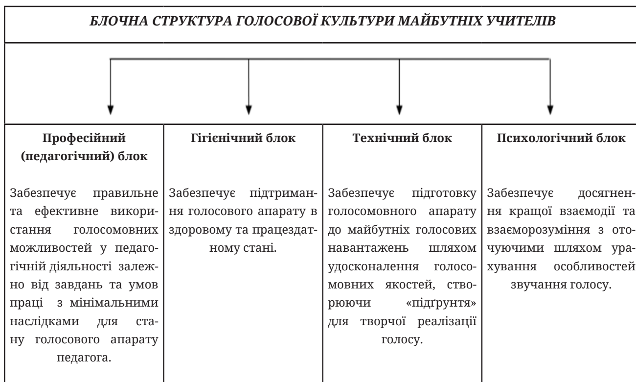
Рис. 1. Блочна структура голосової культури майбутніх учителів

На рис. 1 представлено блочну структуру голосової культури майбутніх учителів.