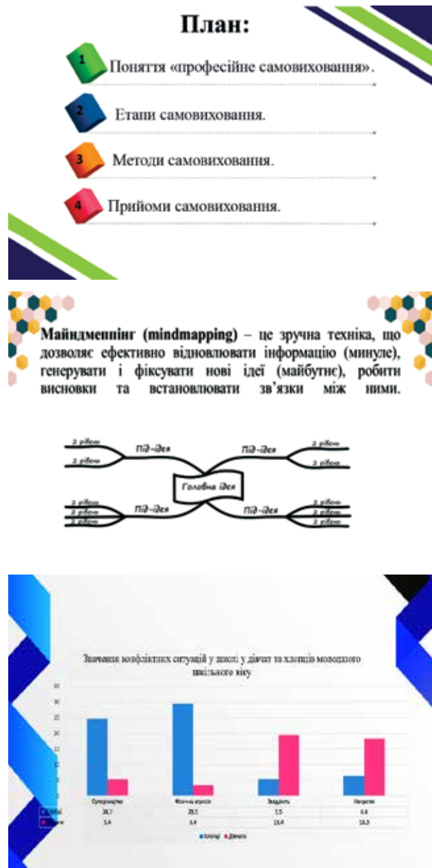
Рис. 1. Слайди для лекції-презентації з навчальної дисципліни «Педагогічна майстерність».