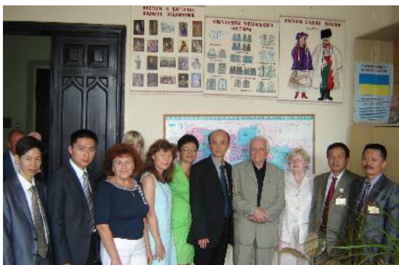
На кафедрі історії України з колегами та іноземною делегацією (2008 р.)