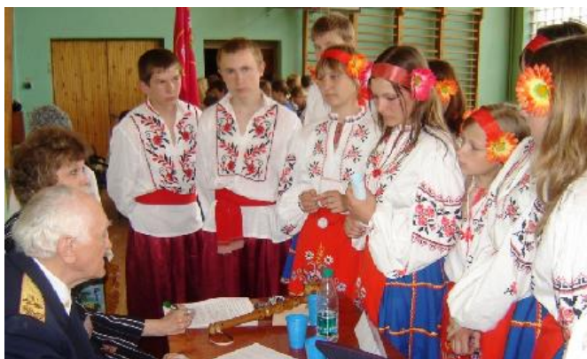
Під час «Турніру знавців історії козацтва» (2006 р.)

важливість козацького коріння для самоідентифікації сучасних українців.