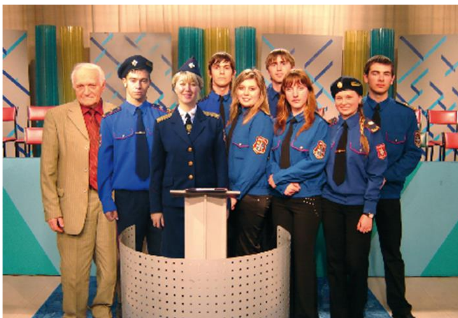
На Обласному телебаченні (2008 р.)

спортивні змагання за «Кубок Отамана»; науковий конкурс «Турнір знавців історії козацтва»; мистецький конкурс «Найкраща писанка»; уроки «Козацька слава»; екскурсійні поїздки місцями козацької слави. Всі