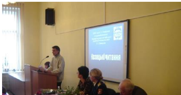
Під час роботи пленарної секції студентсько-учнівської конференції «Козацькі читання» (2007 р.)