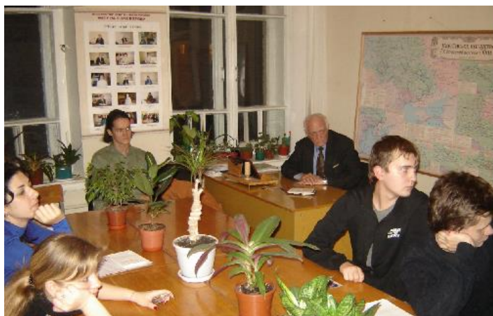
Засідання дебатного клубу «Толерант» на історичному факультеті (2010 р.)

процесу на лекційних та семінарських заняттях. Зокрема, В. Я. Білоцерківський розробив авторські курси: «Феномен українського козацтва», «Історія України в історичних постатях», які викладав майбутнім вчителям історії. Ці ідеї повністю відображені у його навчальних посібниках з історії України та історії української культури [1; 6].