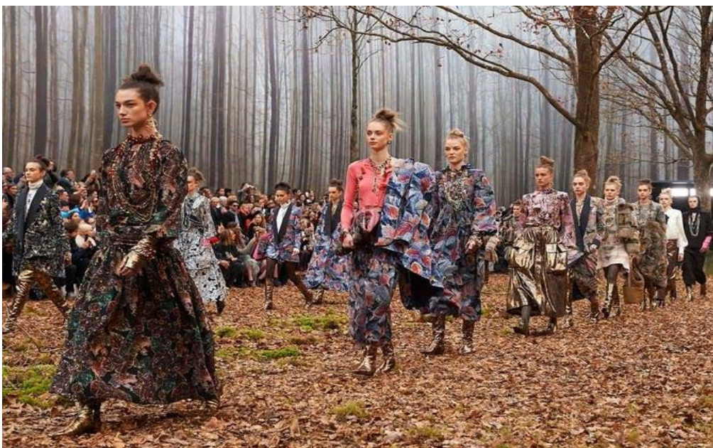
Рисунок 4 – осіння колекція Карла Лєгерфельда

У свою чергу Карл Лагерфельд в своїй колекції Chanel «Осінь-Зима 2018-2019» (див. рисунок 4) продемонстрував багатство візерунково-рельєфних фактур у поєднанні з гладкими [3].