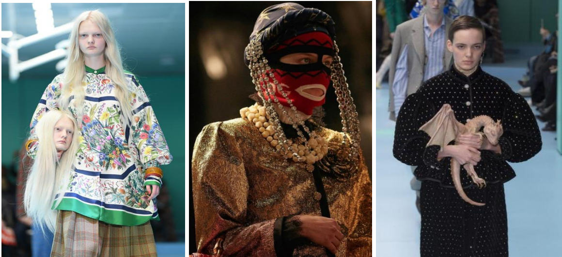
Рисунок 3 – колекція Алессандро Микеле «осінь-зима 2018-2019»

драпіровки, складки, лакову шкіру, трикотажні полотна, рюши, оборки, хутро та аплікації [4]. Ця колекція поєднує у собі стилі фактур, які, здавалося б, неможливо поєднати між собою: трикотажна в'язана маска з елегантним блискучим піджаком та східною чалмою, чи клітчата довга спідниця з розписною блузою та інше.