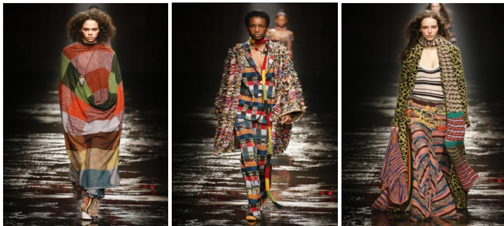
Рисунок 2 – застосування фактур на прикладі італійського бренду Missoni

Прикладів серед дизайнерів та брендів, які успішно задіяли фактуру у своїх колекціях, існує велика кількість. Італійський бренд Missoni створив трикотажну колекцію Осінь-Зима 2018-2019 (див. рисунок 2) на основі геометрії ломаних та прямих ліній яскравої палітри та анімалістичних узорів на трикотажних платтях і пальто [8].