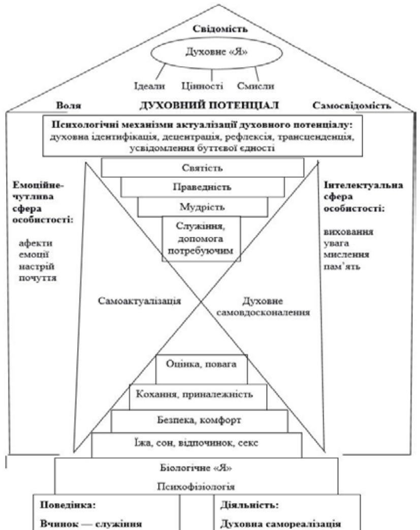
Рис. 9. Структурна організація духовного потенціалу особистості [9]