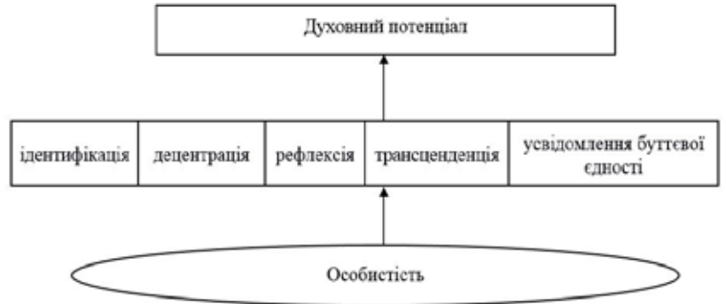
Рис. 8. Психологічні методи актуалізації духовного потенціалу особистості

Духовний потенціал особистості не є величиною постійною, так як в функціональному вимірі свідомість, самосвідомість і воля особистості знаходяться в постійному розвитку. У змістовному вимірі