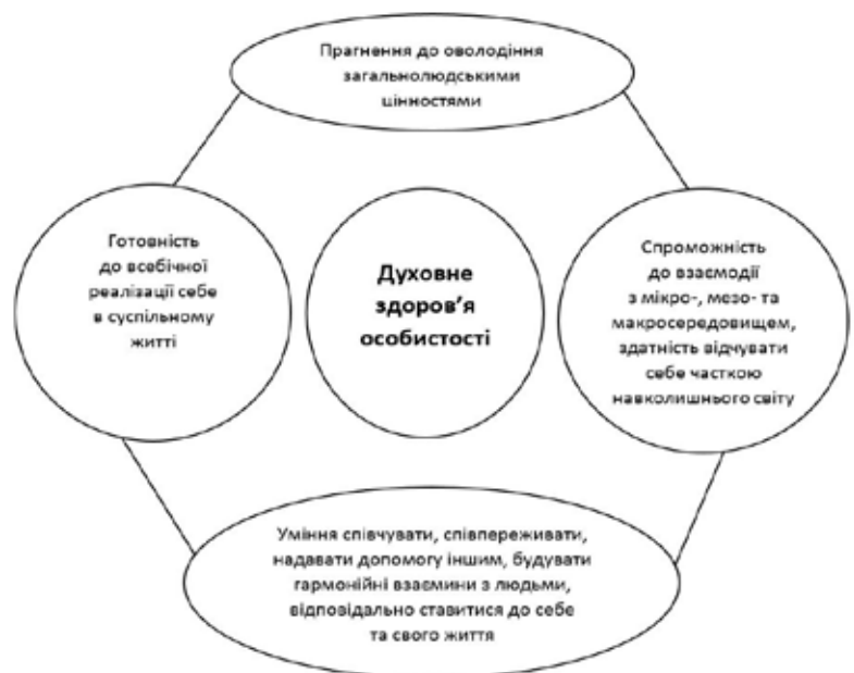
Рис. 4. Духовне здоров'я особистості