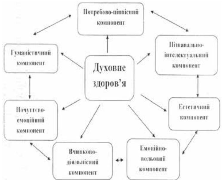
Рис. 5 Структурні компоненти духовного здоров'я

Всі діагностичні підходи повинні здійснюватися в рамках етичних норм. Духовні потреби дитини є індикатором, який свідчить про її духовний потенціал, з іншого боку — це камертон, який задає тональність особистісного розвитку в руслі Краси, Добра, Істини, Любові.