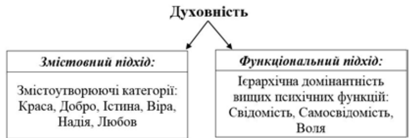
Рис. 3 Змістовно-функціональний склад категорії духовності

У функціональному вимірі діагностика духовного потенціалу повинна бути спрямована на: 1) дослідження його кількісних характеристик (рівень розвитку); 2) виявлення рівня свідомості і ціннісних орієнтацій особистості; 3) виявлення рівня відповідальності як ознаки волі і духовної самосвідомості; 4) дослідження духовної ідентифікації, децентрації, рефлексії, трансцендентності, усвідомлення, буття (буттєвої) єдності; 5) визначення рівня актуалізованості мотивів духовного розвитку.