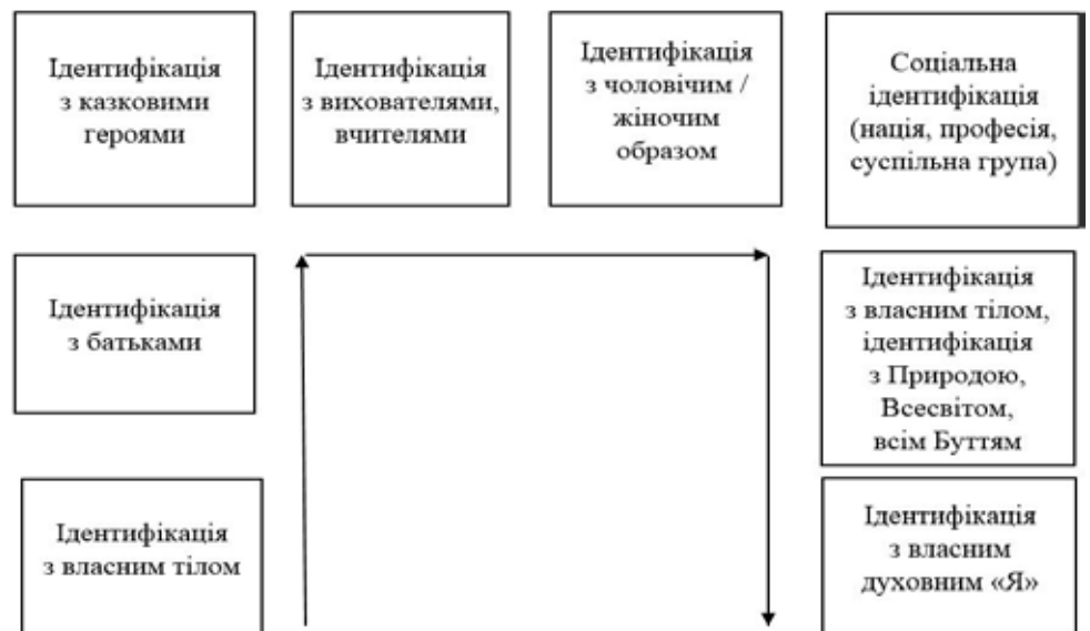
Рис. 7. Етапи біологічної, соціальної і духовної ідентифікації особистості

Осмисленість дозволяє особистості проаналізувати події власного життя, свого шляху і інтегрувати особистісні придбання в цінний духовний досвід.