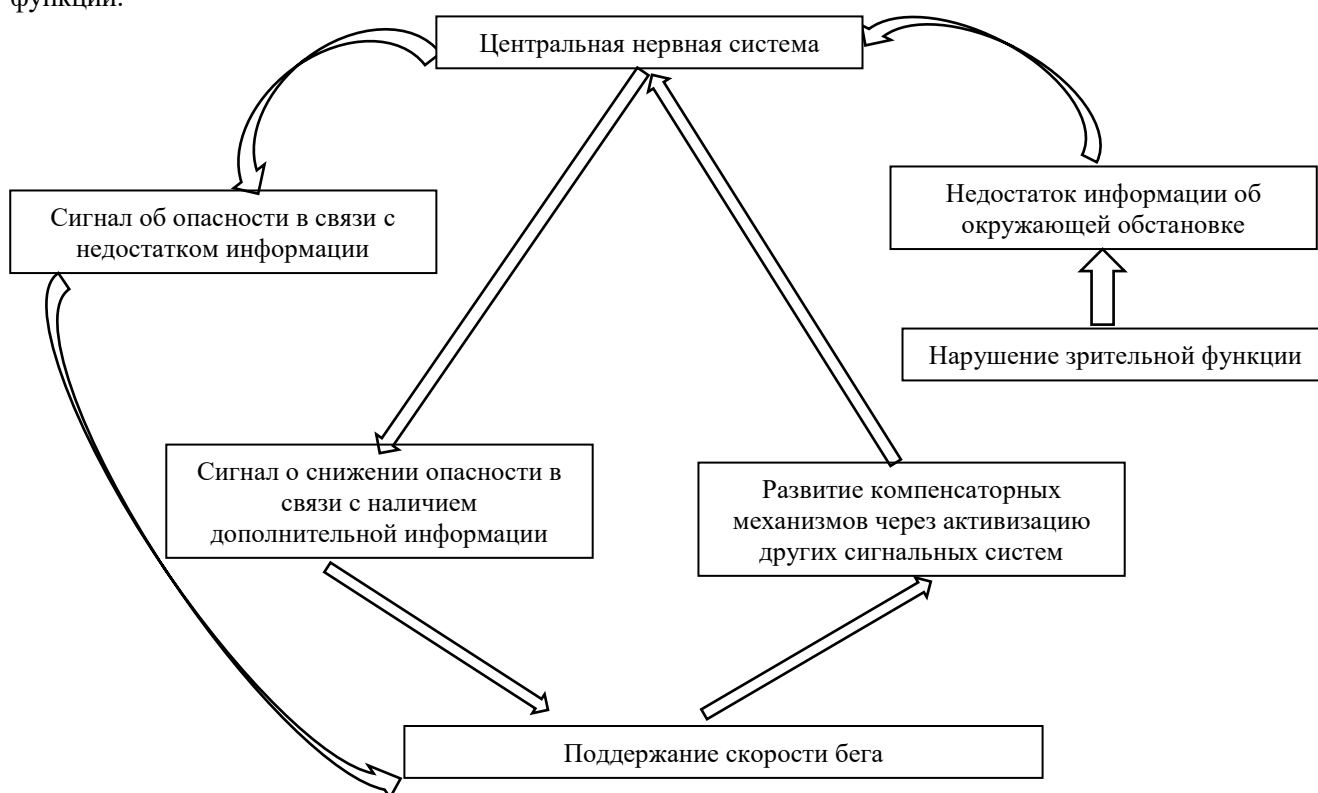
Рис. 3. Схема компенсации недостаточности функции зрительного анализатора при регуляции скорости и направления бега в зависимости от зрительного восприятия окружающего пространства

В качестве компенсаторных механизмов может выступать повышенное восприятие сигналов от слуховых рецепторов, от проприорецепторов мышц, могут в большей степени, чем у здоровых спортсменов развиваться такие специфические чувства, как «чувство дорожки», «чувство дистанции» и др. Эти сигналы могут полностью или частично блокировать сигналы об опасности, связанные с недостатком зрительной информации, и обеспечивать скорость бега, характерную для возможностей двигательного аппарата (рис. 3).