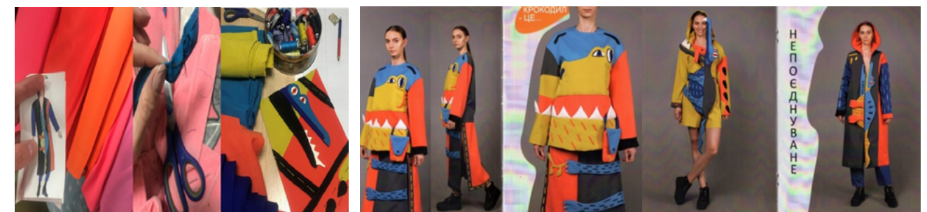
Рис. 5. Колекція «Crocodile Style» Палеха О. Міський конкурс креативних проєктів Create Kharkiv 2020, Міжнародний конкурс «ПЕЧЕРСЬКІ КАШТАНИ» м. Київ

Тренд створення нових фактурних поверхонь постійно провокує студентів дизайнерів на інновації, і нові наукові і дизайнерські розробки. Фактура насичується об'ємними доповненнями: ворс, вузли, букле, каміння, кисті, джгути, аплікації - все це збільшує загальну масу виробу. Не дивлячись на те, що всі техніки є традиційними і давно відомими, але використання нетрадиційних матеріалів і прийомів не властивих цій техніці, надає виробам авангардного звучання. При розробці колекції «Crocodile Style» застосовувалися евристичні методи: метод асоціацій і метод трансформацій. Завдяки цим методам і застосовуваним технікам аплікація були створені авторські фактури, що мають нескінченну варіативність (див. рис 5.).