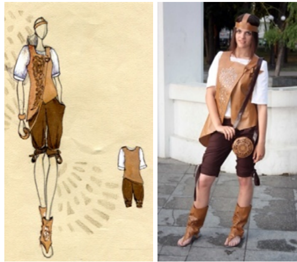
Рис. 6-а. Колекція «Подих»

Додаткових фактурних поверхонь можна домогтися, використовуючи: вишивки, перфорації, строчки, пришивні елементи, заціпи, утворення складок, розтягування, тертя, тиснення, нанесення об'ємних малюнків, нанесення фотографії. «Лазерна перфорація» звучить як термін з пластичної хірургії. Вона подібно найгострішого скальпелю дозволяє дизайнерам робити прорізи в тканині різної товщини і текстури, а також дозволяє досягти повної симетричності і високої точності малюнка. Перфорація сьогодні застосовується для виготовлення складних, авторських візерунків, в тому числі на шкірі (див. рис 6-а, 6-б).