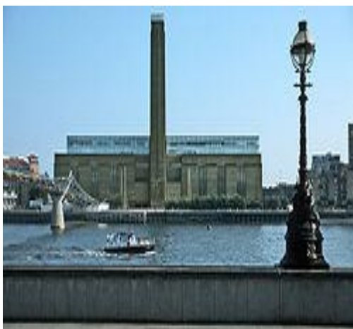
Рис. 3 Галерея Тейт Модерн (Tate Modern) в Лондоні

Однією з найпопулярніших тенденцій є організація музеїв в приміщеннях старих недіючих промислових будівель. В 2000 р. фірма Херцог де Мерон (Herzog de Meuron) трансформувала будівлю електростанції в галерею Тейт Модерн (Tate Modern) в Лондоні (Рис. 3).. Дизайнерська концепція включала скульптуру, меблі, світловідбиваючі елементи, що відозмінювали простір, тим самим надаючи нове сприйняття художніх робіт. (Рис.4)