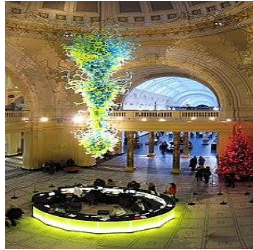
Рис. 2. Головний вестибюль Музею Вікторії і Альберта.

Це дає змогу відвідувачам відпочити та відволікти увагу.