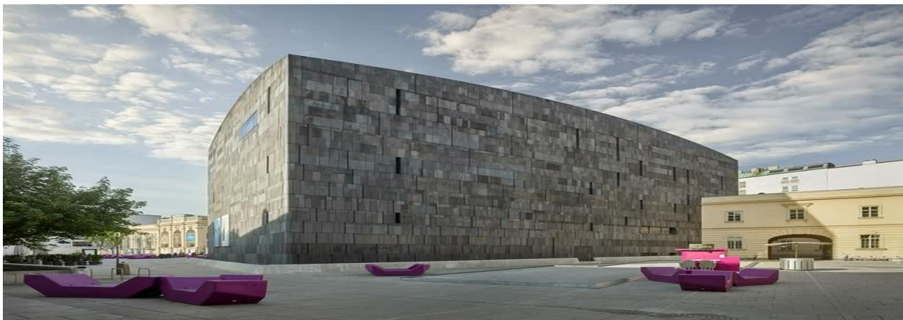
Рис. 5. Музей сучасного мистецтва у Відні.

Відні. Тут екологічні стенди музею, що виготовлені зі звичайних товарних ящиків, дуже сучасно та вдало вписуються в інтер'єр. А зовнішній простір музею доповнюється незвичайними лавами та водоймою, що приваблює та спонукає зайти всередину. (Рис 5).