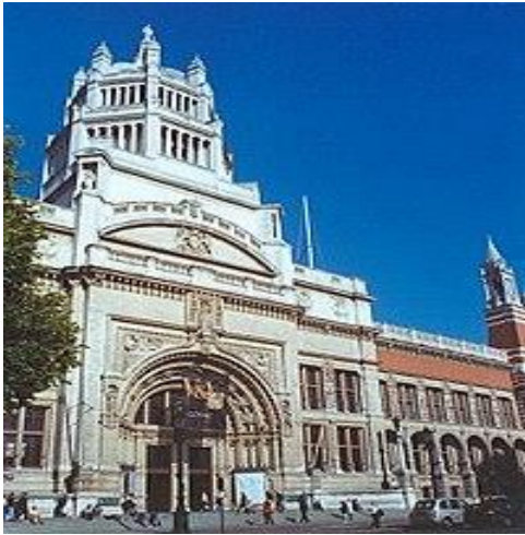
Рис. 1 Музей Вікторії та Альберта в Лондоні.