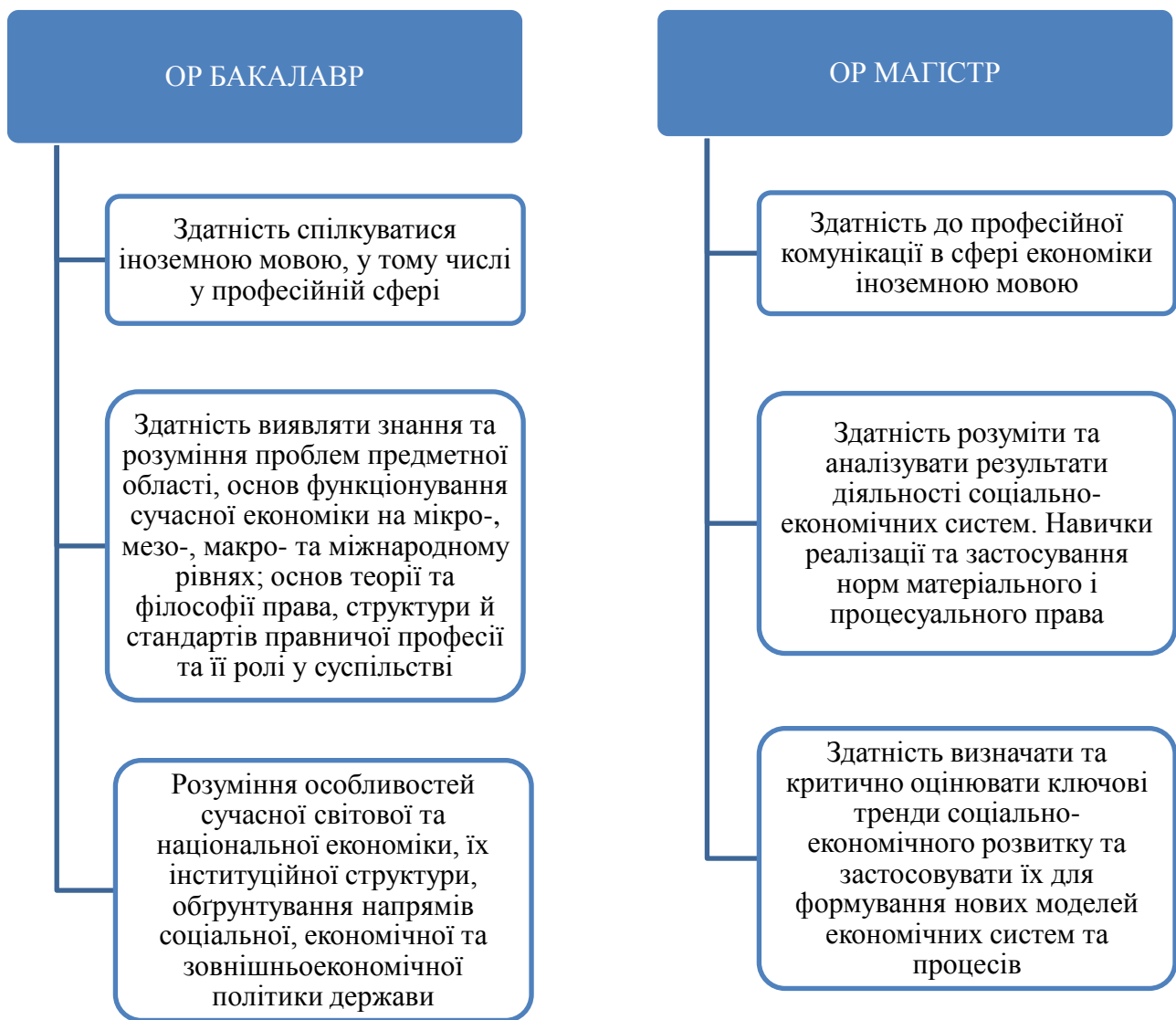
Рисунок 1.3. Компетентнісні складові комунікативної та інтернаціональної підготовки економіста