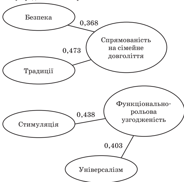
Рис. 2. Взаємозв'язок ціннісних орієнтацій із компонентами психологічного здоров'я сім'ї

Встановлено взаємозв'язок ціннісних орієнтацій із компонентами психологічного здоров'я сім'ї. Результати кореляційного аналізу представлено на рис. 2.