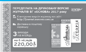
Паперова передплата — Код: 20ППС024

Картку можна замовити: за тел. (057) 731-96-36, на сайті http://book.osnova.com.ua Активувати картку просто — необхідно дотримувати інструкцій, зазначених на звороті.