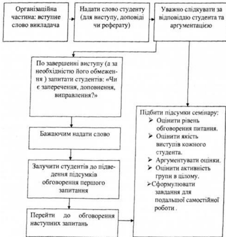
Рис. 1. I-й варіант проведення семінарського заняття