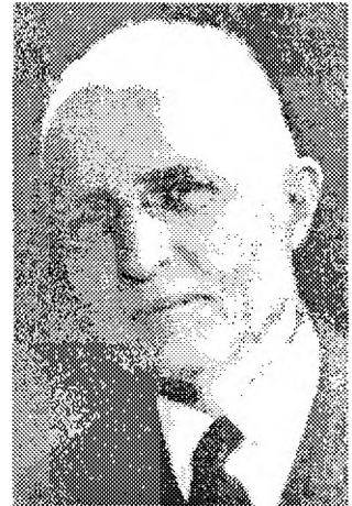
Вальтер Ойкен (1891–1950)

Одним із основоположників Фрайбурзької школи вважається Вальтер Ойкен. Основні праці: «Основи національної економіки» (1947), «Основні принципи економічної політики» (1950). Ойкен сформулював учення про типи економічних порядків. Економічний порядок Ойкен розумів як сукупність норм і практик економічних відносин, у рамках яких перебігає конкретний господарський процес. Ойкеном виділено два типи економічних порядків: 1) центрально-кероване; 2) ринкове господарство. Вони не зустрічаються в чистому вигляді, а тільки у змішаному із переважанням елементів одного з них.