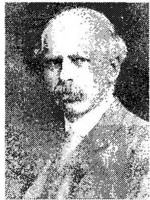
Леонард Трелоні Гобгауз (1864–1929)

Аналізуючи функції держави, політичний філософ, соціолог, провідний теоретик англійського соціального лібералізму Леонард Трелоні Гобгауз у роботі «Лібералізм» (1911) зазначав, що однією з важливих її функцій є забезпечення умов для розвитку розуму та характеру індивіда. Теоретик вважав, що крім прав на власність чи на індивідуальну свободу, які вважалися фундаментальними у класичному лібералізмі, слід визнати такими ж фундаментальними права індивіда на працю та прожитковий мінімум. Мислитель сформулював колективне право на рівність у комерційних угодах («справедлива згода»), обґрунтував необхідність більшого втручання в економіку для досягнення в першу чергу суспільного, а не особистого блага.