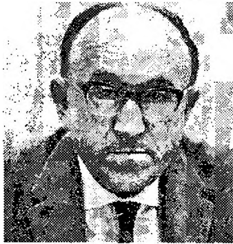
Альфред Мюллер-Армак (1901–1978)

не, але розумне втручання держави в економіку, перш за все в соціальну сферу при дотриманні фундаментальних принципів ринкової економіки. Таким чином, економічний і політичний порядки мають підтримувати один одного, а не домінувати або ксрувати один одним.