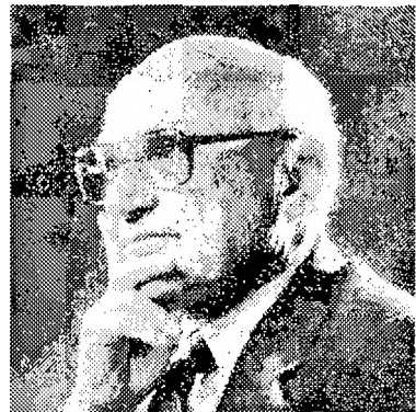
Мілтон Фрідман (1912–2006)

Фрідман досліджував співвідношення між економічною та політичною свободою. Для нього економічна свобода є не просто необхідною, а й умовою для політичної свободи. Він доводить, що економічна свобода має бути вихідною точкою для урядування, оскільки у ній полягає принцип спільної вигоди від взаємодії між суб'єктами на ринку. Держава в ліберальному суспільстві має виробляти закони, порядок взаємодії суб'єктів та охороняти право власності, як і чинити вплив на монополії та займатись нейтралізацією зовнішніх чинників, що впливають на економіку. І держава має керувати грошми.