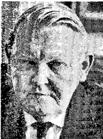
Людвіг Ерхард (1897–1977)

У цілому, ордоліберали розглядали суспільний розвиток крізь призму еволюційного підходу, розробляючи концепцію соціального ринкового господарства. Практичне втілення ордоліберальних ідей – так зване «німецьке диво» – відбулося з приходом до посади канцлера Німеччини теоретика та практика соціального лібералізму, «соціального ринкового господарства» Людвіга Ерхарда. Будучи adeptом ордолібералізму, він запровадив відповідні економічні реформи, що врешті призвело до ефективної