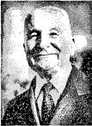
Людвіг фон Мізес (1881–1973)

розробки австрійського економіста Людвіга фон Мізеса . Основні праці: «Соціалізм: економічний та соціологічний аналіз» (1922), «Людська діяльність: трактат із економічної теорії» (1949).