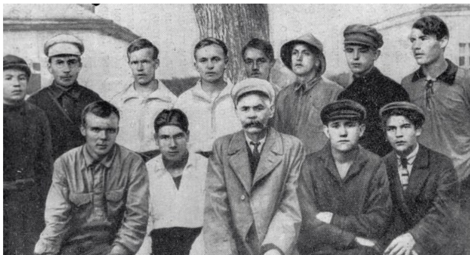
Зустріч М. Горького з вихованцями А. С. Макаренка. 1928 р.

Відеоподкаст «Життєвий шлях видатного педагога А. С. Макаренка»