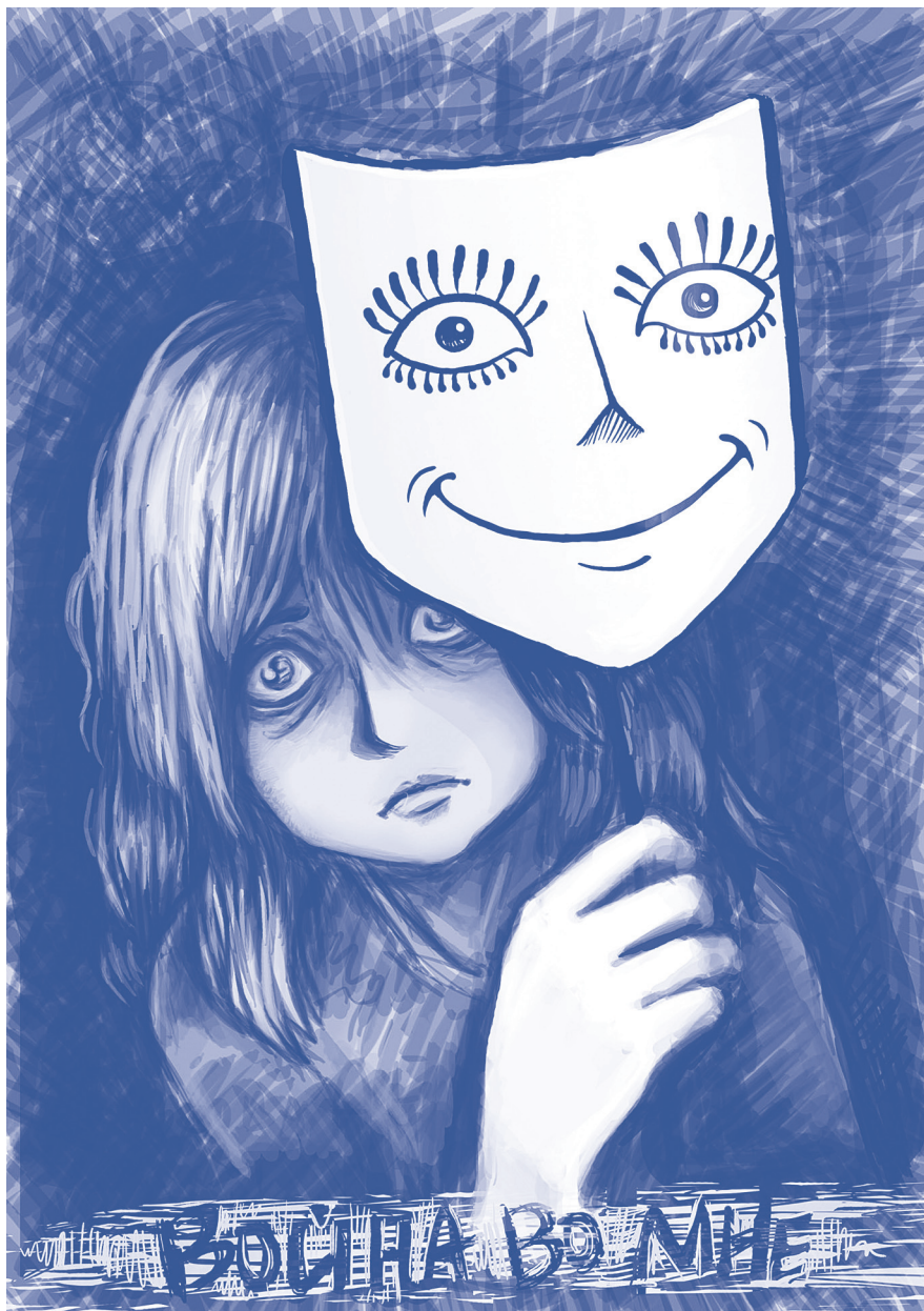
Автор малюнків: Рожкова Анастасія , народилася та виросла в Луганську, виїхала влітку 2014 року.

процес інтеграції переселенців до громад, в які вони перемістились. З іншого боку, інтереси ВПО, згідно з теорією участі в прийнятті рішень, краще всього можуть представити на всіх рівнях влади самі ВПО, що реалізувало б ідею участі ВПО в рішенні своїх проблем найкращим способом.