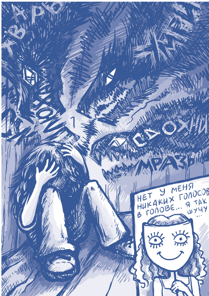
Автор малюнків: Рожкова Анастасія, народилася та виросла в Луганську, виїхала влітку 2014 року.

і простору для скарг. 7. Формування ідеї взаємної підтримки в групі переселенців. 8. Фасилітація вирішення проблем. 9. Створення перспективи подальшого розвитку, активованого лихом. 10. Переоцінка та рефлексія трагічного досвіду. 11. Застосування творчих завдань та елементів арт-терапії. 12. Навчання основним методам саморегуляції. 13. Заохочення гумору в групі [29,с.42-44].